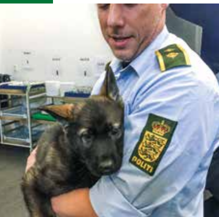
Dalton otte uger, Nordsjællands Politi.