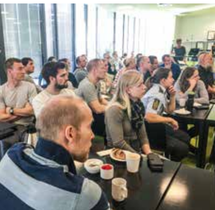
Politistationen i Roskilde.