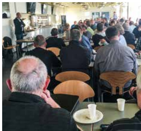
Stort fremmøde på politigården i Aarhus.